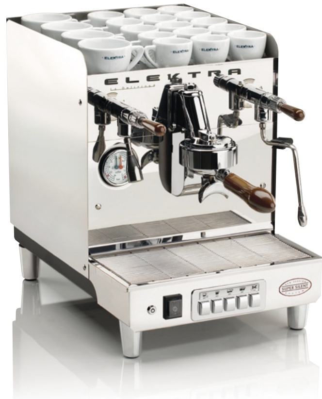
SIXTIES T1. 1 GRUPPO AUTOMATICA. ACCIAIO INOX SUPER LUCIDO SIXTIES T1. 1 UNIT AUTOMATIC. ULTRA POLISHED INOX