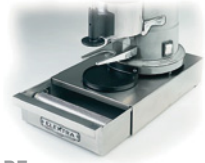
BF Cassetto "battifondi" per macinadosatore, acciaio inox. Knock-out box & base for espresso grinder, stainless steel.