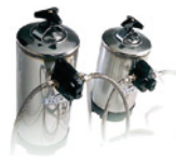
DA12 DA8 Depuratore automatico Automatic purifier DA12, 12-liters / DA8, 8-liters.