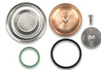
02367034 Kit Cialda Kit for Pods