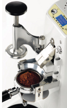
Pressa caffè brevettato Patented coffee tamper