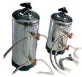
DVA12 DVA8 Depuratore Purifier DVA12, 12-liters / DVA8, 8-liters