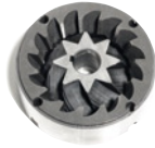
Macine Coniche Conical Mills