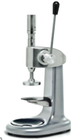
CSP Pressino Dinamometrico. Dinamometric Tamper.