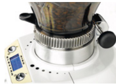
Regolazione micrometrica Micrometric adjustment