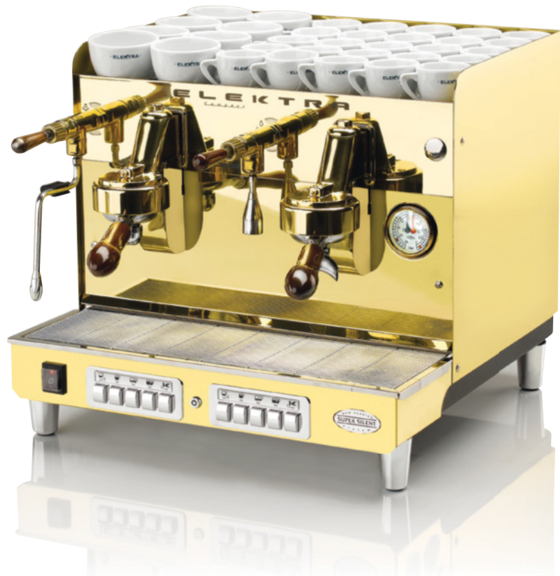
SIXTIES HL1. 2 GRUPPI AUTOMATICA. OTTONE SUPER LUCIDO

SIXTIES HL1. 2 UNITS AUTOMATIC. ULTRA POLISHED BRASS