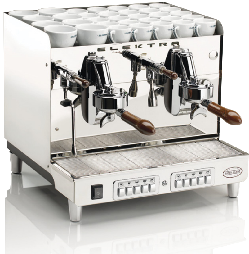
SIXTIES T3. 2 GRUPPI AUTOMATICA. ACCIAIO INOX SUPER LUCIDO SIXTIES T3. 2 UNITS AUTOMATIC. ULTRA POLISHED INOX