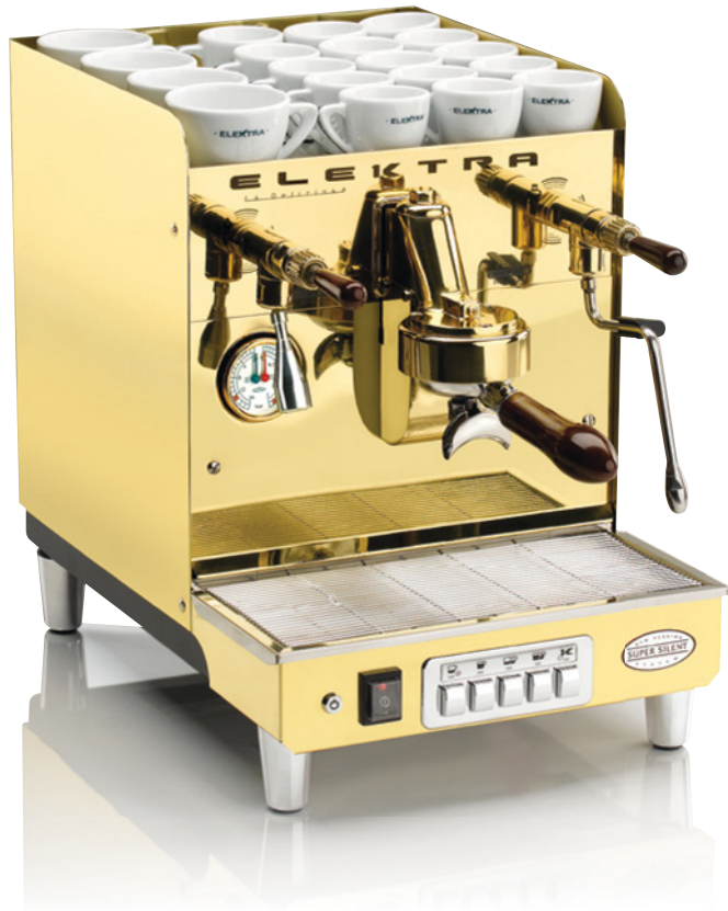
SIXTIES GL1. 1 GRUPPO AUTOMATICA. OTTONE SUPER LUCIDO SIXTIES GL1. 1 UNIT AUTOMATIC. ULTRA POLISHED BRASS

IL VALORE DELL'ESSENZIALE THE VALUE OF THE ESSENTIAL