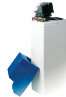
DAS26 Depuratore cabinato 26 litri a timer automatico. Boxed automatic 26-liters purifier with automatic timer.