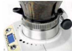
Regolazione micrometrica Micrometric adjustment