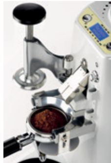
Pressa caffè esclusivo Exclusive coffee tamper

Disponibile anche nelle versioni in colore Bianco perlato o Nero perlato Available in Pearl White and Pearl Black colors